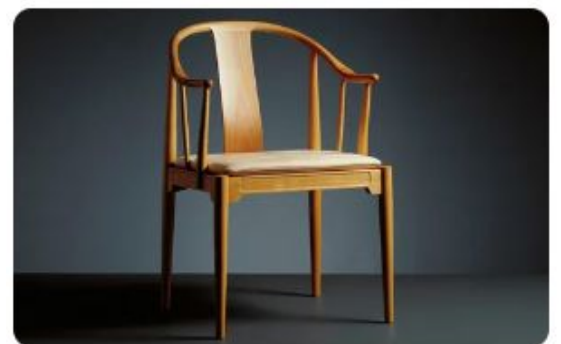
Chair - Cadeira