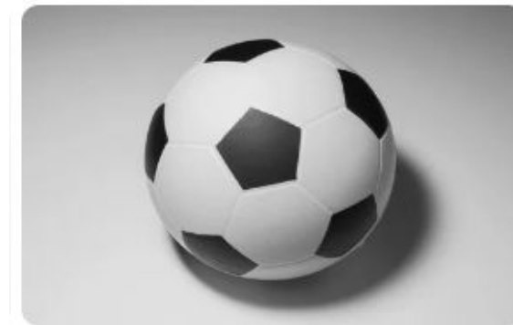
Ball - Bola