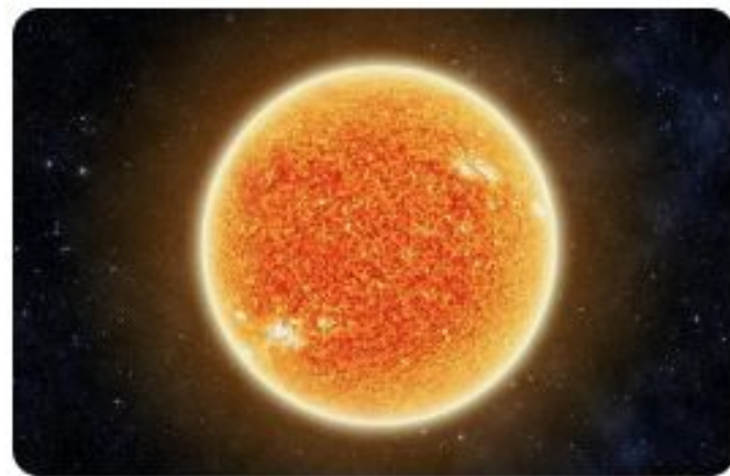
Sun - Sol

O método do Design Visual para aprender inglês com imagens é uma abordagem que se baseia na associação visual de palavras em inglês com imagens correspondentes.