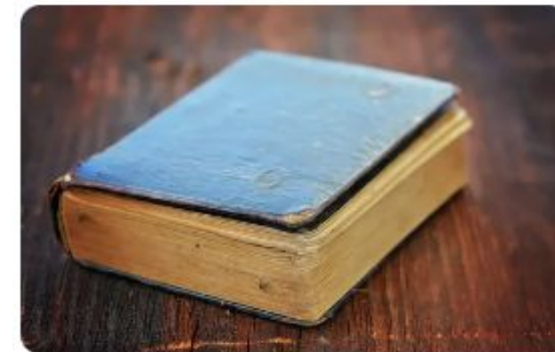
Book - Livro