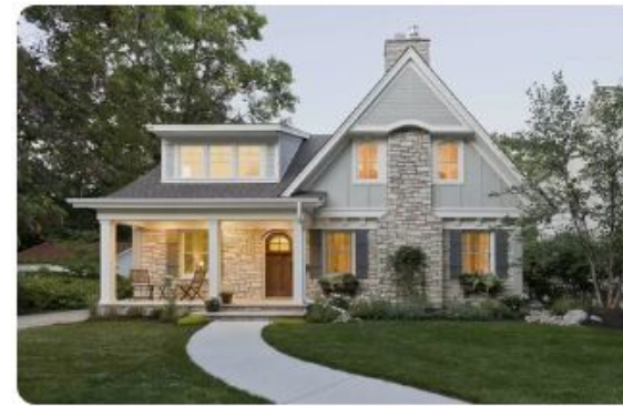
House - Casa