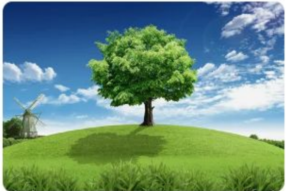
Tree - Árvore