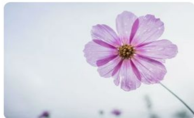
Flower - Flor