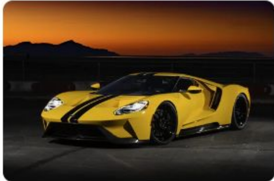
Car - Carro