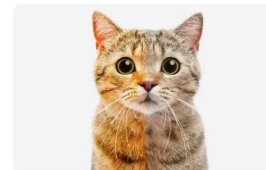
Cat - Gato