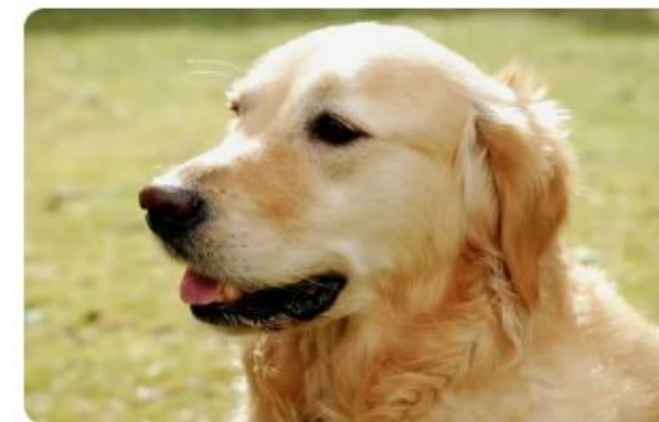
Dog - Cachorro